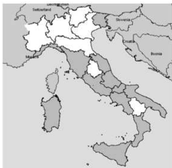
Fig. 1 - Regioni in cui è stata segnalata Ostreopsis spp.:

■ 2005: Liguria-Toscana-Lazio-Campania-Calabria-Puglia-Molise-Sicilia-Sardegna ■ 2006: Abruzzo-Marche-Friuli Venezia Giulia